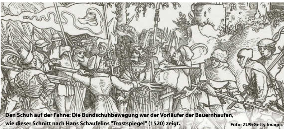
Den Schuh auf der Fahne: Die Bundschuhbewegung war der Vorläufer der Bauernhaufen, wie dieser Schnitt nach Hans Schaufelins "Trostspiegel" (1520) zeigt.

In Baden-Württemberg werden den aufständischen Bauern dieses Jahr etliche Veranstaltungen und Ausstellungen gewidmet. So hat das Landesmuseum Württemberg gleich mehrere große Projekte auf den Weg gebracht: Von der Erlebnisausstellung „Protest!“ in Stuttgart über spektakuläre KI-Projekte („Uffruhr!“) in Bad Schussenried, die auch mobil unterwegs ist oder einer Kinderausstellung („Zoff!“). Doch auch an den historischen Stätten im Kraichgau, Heilbronn oder Böblingen ist zum 500. Jahrestag der Aufstände einiges an Programm geboten. (js)