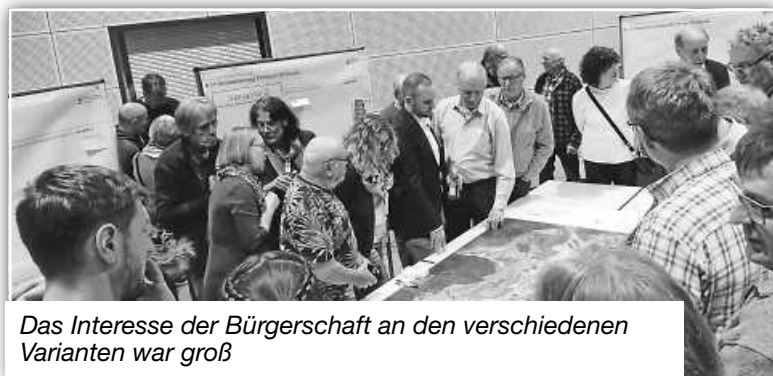
Das Interesse der Bürgerschaft an den verschiedenen Varianten war groß