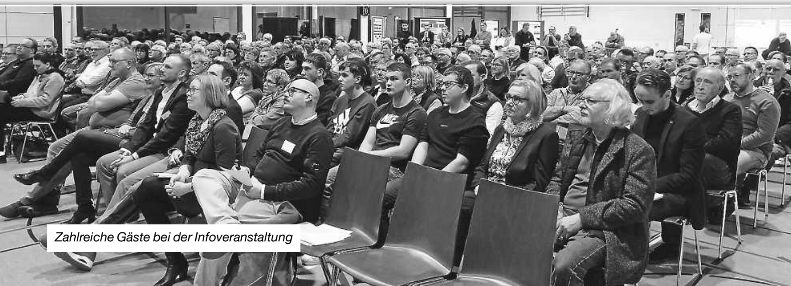
Zahlreiche Gäste bei der Infoveranstaltung