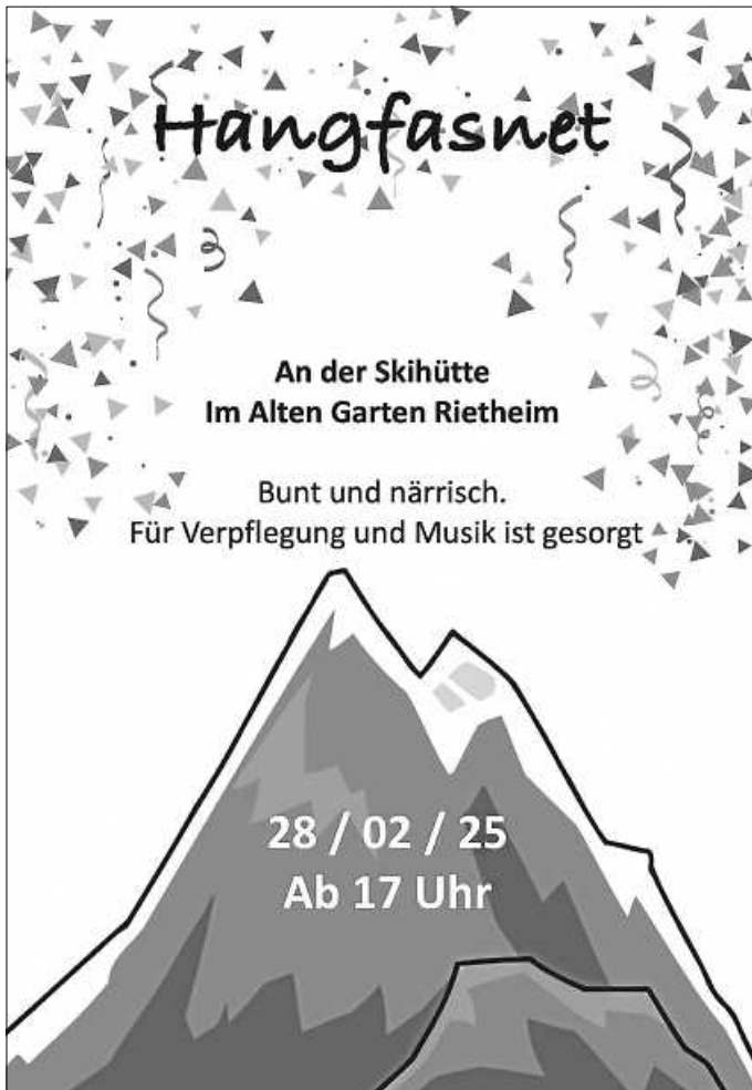
Plakat: S. Jakic