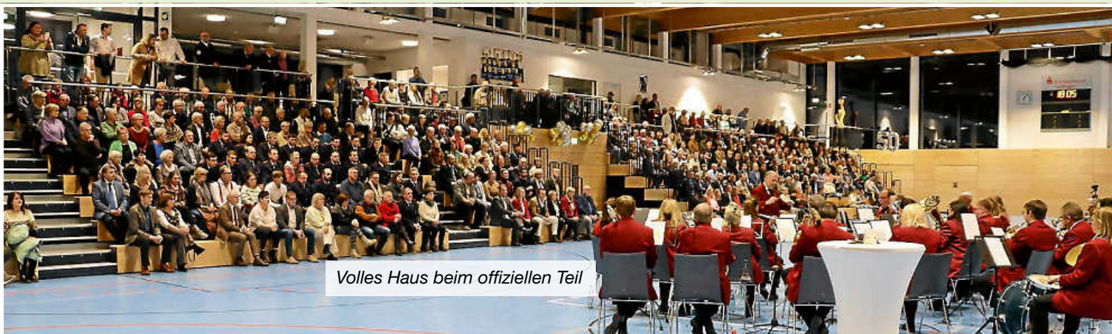
Volles Haus beim offiziellen Teil