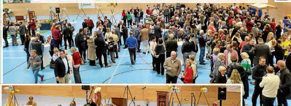
Ein gelungener Auftakt zum Jubiläumsjahr 2025 in geselliger Runde bis in die späten Abendstunden.