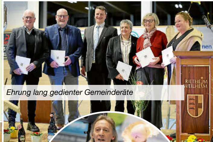
Ehrung lang gedienter Gemeinderäte