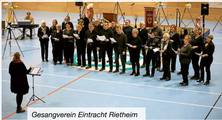
Gesangverein Eintracht Rietheim