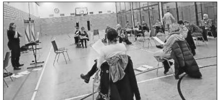
Singen unter Coronabedingungen