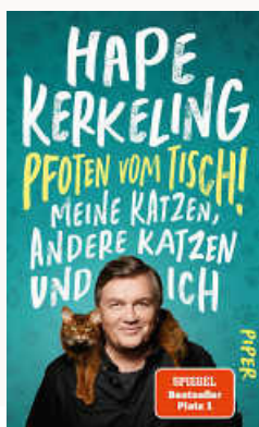
Kerkeling, Hape: Pfoten vom Tisch Piper Verlag, 293 S. EUR 22,-

Um einer Gewichtszunahme des Seniors entgegenzuwirken, sollte die Futtermenge entsprechend angepasst werden. Viele ältere Katzen benötigen nun weniger, einige sogar mehr oder energiereicheres Futter. Jedes Pfund zu viel belastet die Gelenke des Tieres und erhöht auch die Gefahr, an Diabetes zu erkranken. Viele kleine Portionen sind für das Magendarmsystem des Vierbeiners verträglicher als wenige große Mahlzeiten. Besonders für alte Katzen ist es wichtig, ausreichend zu trinken, weswegen der