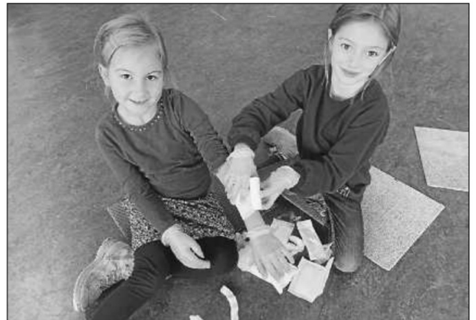
Schüler üben Verband anlegen

Wir bedanken uns ganz herzlich bei den Eltern, Feuerwehr, DRK und Polizei für ihren großartigen Einsatz!