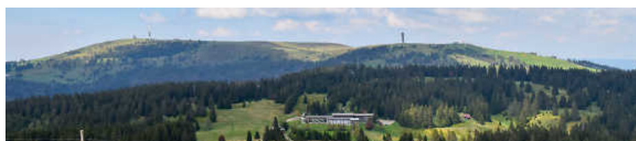
Blick vom Herzogenhorn auf den Feldberg