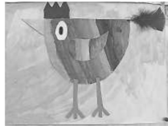
Bunte Hühner - Klasse 1

Wir wünschen allen ein frohes Osterfest und schöne, erholsame Osterferien. Anbei ein paar tolle Werke unserer Schüler zum Thema: Ostern. Durch die Bastelwerke der Schüler ist unser Schulhaus immer schön und bunt dekoriert.