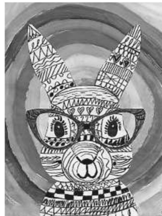
Lustige Hasen - Klasse 2

Wir wünschen allen ein frohes Osterfest und schöne, erholsame Osterferien. Anbei ein paar tolle Werke unserer Schüler zum Thema: Ostern. Durch die Bastelwerke der Schüler ist unser Schulhaus immer schön und bunt dekoriert.