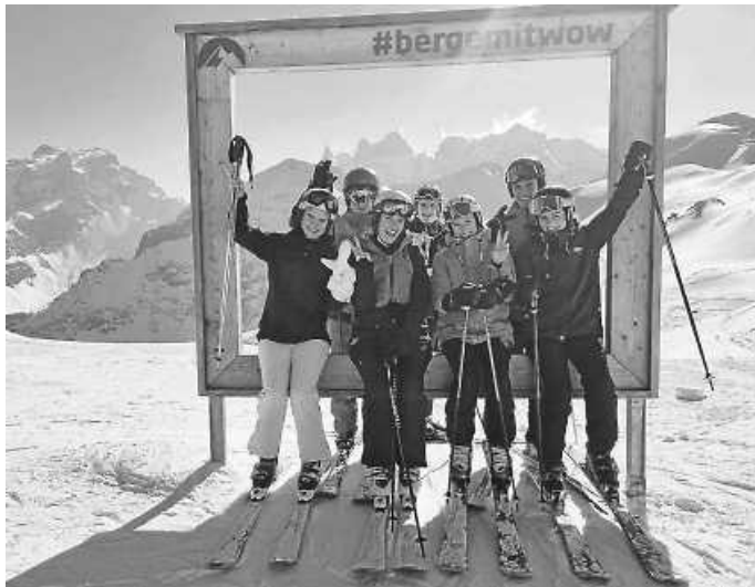
Die jungen Wilden hatten sehr viel Spaß!