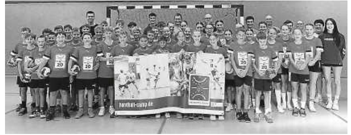
Teilnehmer Camp 2