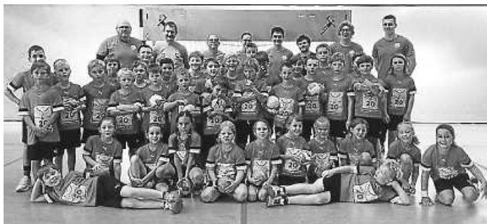
Teilnehmer Camp 1