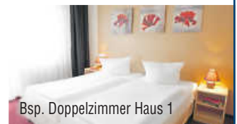
Bsp. Doppelzimmer Haus 1