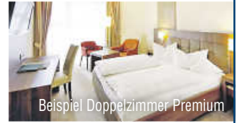
Beispiel Doppelzimmer Premium