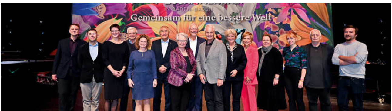
Impressionen vom Forum für Gesellschaftlichen Zusammenhalt 2022 in Baden-Baden.

Buchen Sie jetzt Ihre kostenlosen Tickets!