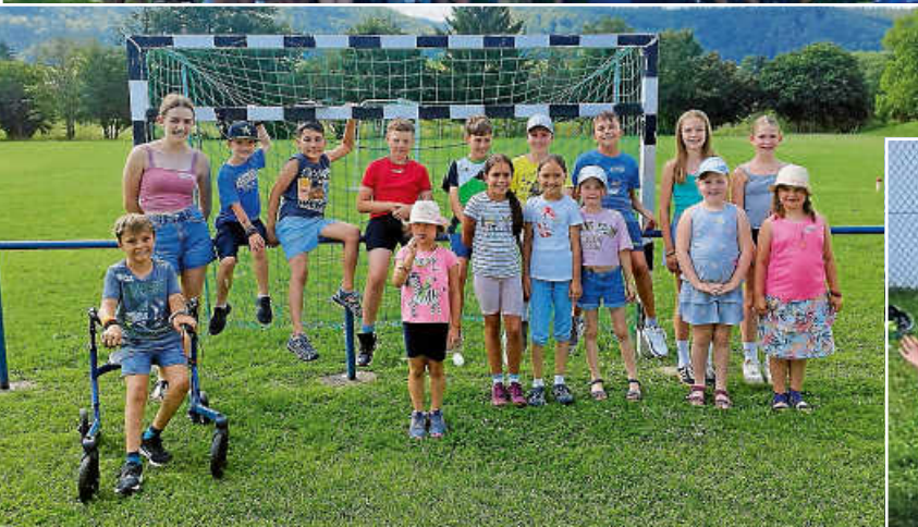
„Handgemachte Seifen und Filzen“ mit der Gemeindeverwaltung