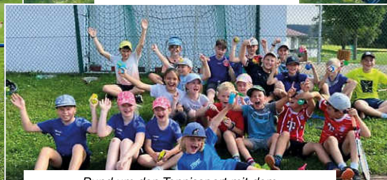
Rund um den Tennissport mit dem Turnerbund Weilheim Abt. Tennis