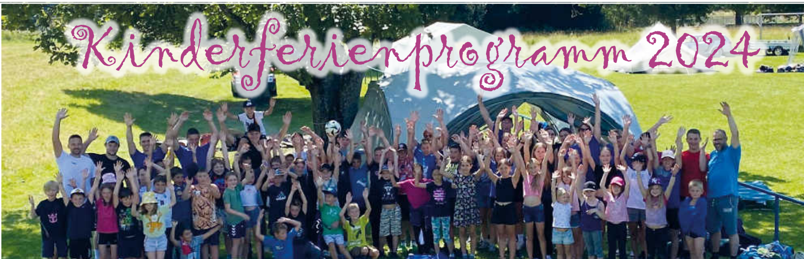
HSG Zeltlager für Groß und Klein!