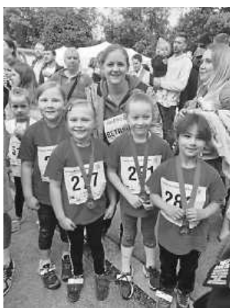
Teilnehmerinnen Jg. 2017