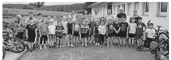
Hier ist die Trainingsgruppe samt Trainern zu sehen.