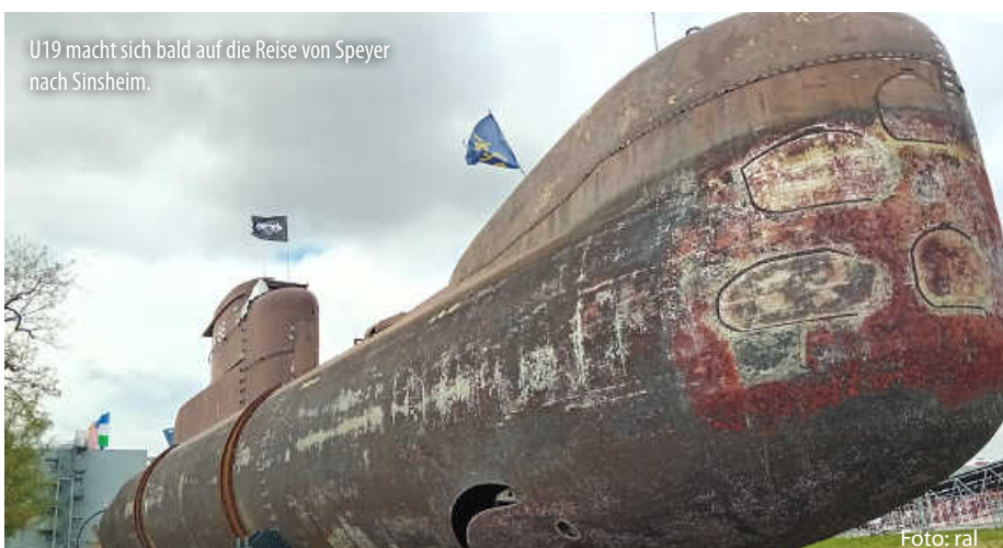
U19 macht sich bald auf die Reise von Speyer nach Sinsheim.

Und auch Tipps zur Freizeitgestaltung finden sich hier: Wie wäre es mit einem Relax-Tag in der Caracalla-Therme Baden-Baden, Action im Europa Park Rust oder einer Wissenstour in der Klima Arena Sinsheim? Möglichkeiten zum Heimat entdecken gibt es genug. Schauen Sie rein. (jr)