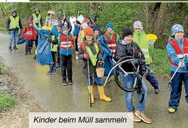
Kinder beim Müll sammeln