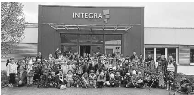
Gruppenbild der Helferinnen und Helfer

Am 17.04.2024 führte die Grundschule Rietheim-Weilheim in Zusammenarbeit mit der Firma Integra Jarit GmbH eine Dorfputzete durch. Viele Kinder waren voller Eifer und Tatendrang dabei.