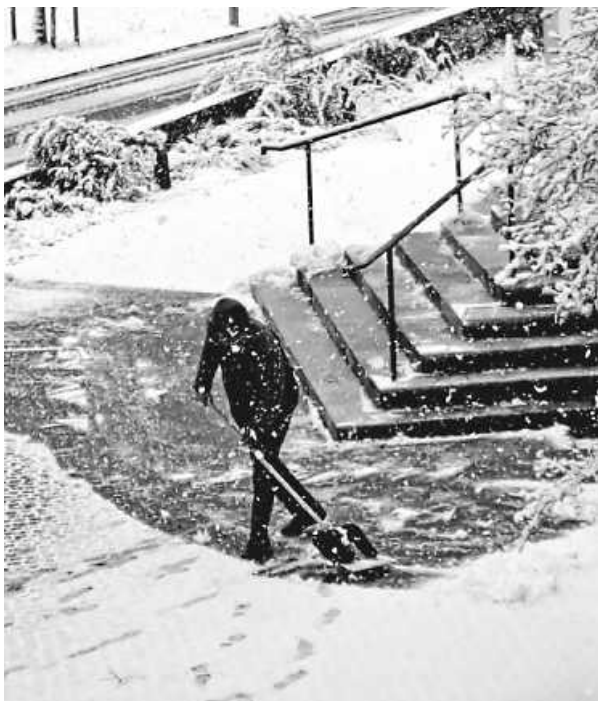
Pfarrer bei der Konfirmationsvorbereitung

Die Konfirmation am Sonntag war ein „Weißer Sonntag“ mit Eis und Schnee.