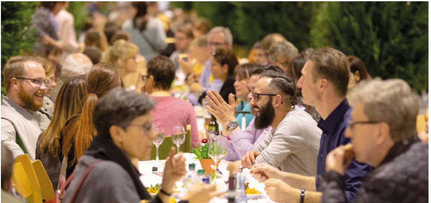
Der Markt des guten Geschmacks mit seinem Wahrzeichen - der Langen Tafel