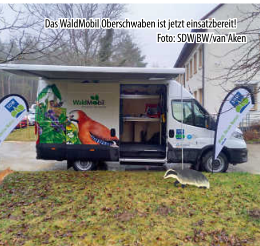
Das WaldMobil Oberschwaben ist jetzt einsatzbereit!