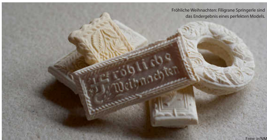
Fröhliche Weihnachten: Filigrane Springerle sind das Endergebnis eines perfekten Modells.

Es zeigt sich also: Die Weihnachtszeit in Baden-Württemberg ist nicht nur von malerischen Landschaften und festlich geschmückten Städten geprägt, sondern auch von einer kulinarischen Vielfalt, die Tradition und Genuss auf wunderbare Weise verbindet. Also nichts wie ans Backbuch, den Ofen, das Nudelholz und die Rührschüssel, und los geht das muntere Weihnachtsbacken. Zeit genug bis zum Fest ist ja noch. (jr)