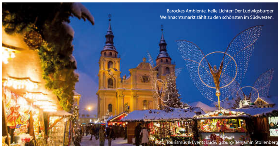
Barockes Ambiente, helle Lichter: Der Ludwigsburger Weihnachtsmarkt zählt zu den schönsten im Südwesten.

Oder kleine, liebevoll inszenierte Adventsmärkte in stimmungsvoller Kulisse, zum Beispiel im Maulbronner Klosterhof zum 2. Advent, oder der Adventsmarkt im Bruchsaler Schlosshof unter der erleuchteten Schlossfassade. Ein Besuch lohnt sich ... (jr/su/red)