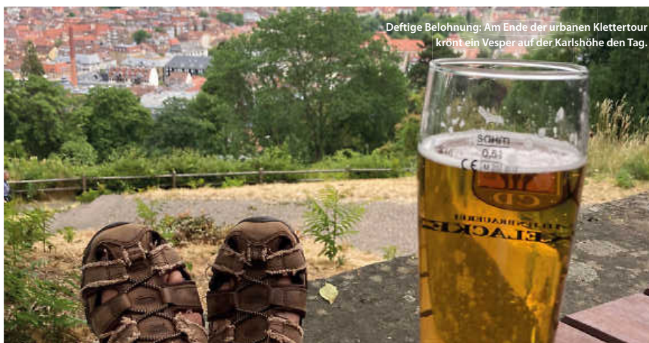
Deftige Belohnung: Am Ende der urbanen Klettertour krönt ein Vesper auf der Karlshöhe den Tag.

Eine Wanderung über die Stäffele ist nicht nur eine großartige Möglichkeit, die Stadt aus ganz neuen Blickwinkeln zu entdecken, sondern auch eine gute Möglichkeit, fit zu bleiben. Aber keine Sorge, die Anstrengung lohnt sich! Am Ende kann man in einem der vielen charmanten Cafés oder Biergärten entspannen und eine Brotzeit oder die Highlights der schwäbischen Küche genießen. Also nichts wie die Laufschuhe geschnürt und bereitmachen zum Aufstieg. Bewegung, Wissenswertes und am Ende ein toller Ausblick warten. (jr)