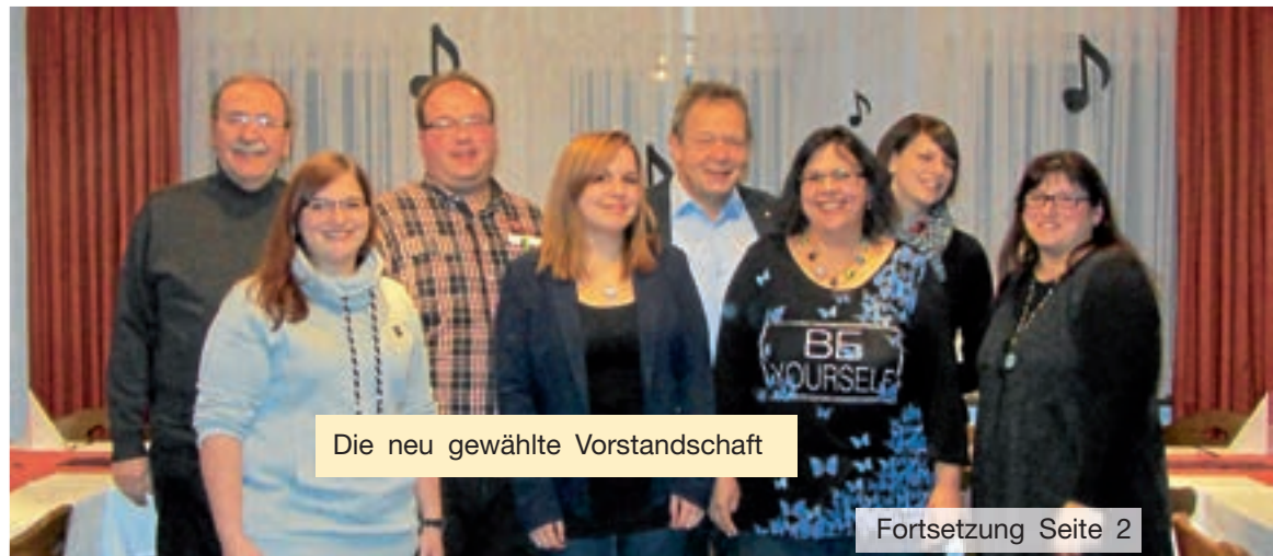
Die neu gewählte Vorstandschaft