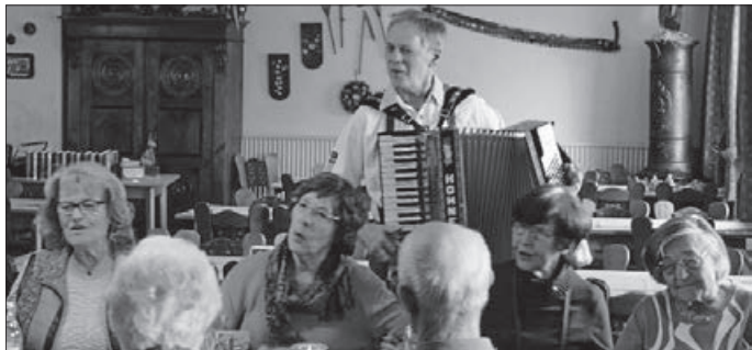
Einkehr beim singenden Wirt

General – „Obri-st Steffen“ sprach im Bus: „aufi geht's, ich fahr euch auf Umweg zum Modehaus Betz“. Ich war erst der Meinung, wir seh'n Blüten am See nee denkste, uff de Alb nuff, viel Reste von Schnee.