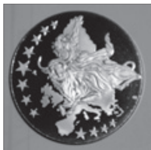
Medaille für den Dichter