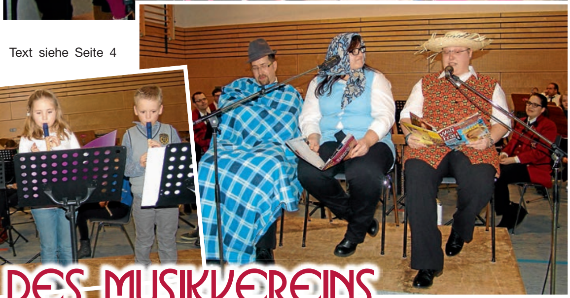
Text siehe Seite 4