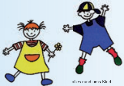
alles rund ums Kind

wann: 12. März 2016 von: 10 - 12 Uhr wo: in der Gemeindehalle Riethem