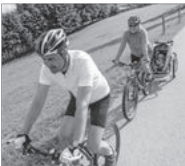
Bei den AOK-Radtreff-Tourenwochen gibt es jeden Sonntag mehrere Radtouren zur Auswahl.

Am gleichen Tag wird im Rahmen der AOK-Radtreff-Tourenwochen auch die Fahrt „Auf dem Jakobusweg nach St. Georgen an den Klosterweiher“ von Schramberg-Sulgen aus angeboten. Noch bis zum 3. Juli bieten die AOK-Radtreff-Tourenwochen jeden Sonntag zwischen drei und fünf geführte Touren in der Region an. Die Teilnahme ist kostenlos, eine Anmeldung oder Mitgliedschaft bei der AOK nicht erforderlich. Es wird empfohlen ein Fahrradhelm zu tragen. Eine Übersicht über alle Radtouren gibt es im Internet unter www.aok-bw.de/sbh , Rubrik „GESUNDNAH erleben“ oder in jedem AOK-KundenCenter. Für Fragen steht die AOK unter Tel. 07721 9447804 zur Verfügung.