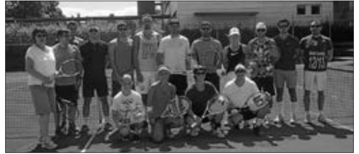
Die Teilnehmer des erstmals wieder durchgeführten Jedermann-Tennis-Turnier.

Anmeldungen wurden hierzu schon angenommen. :-)