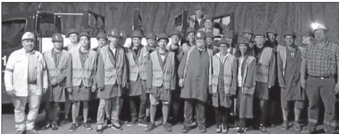
Auszubildende und Studenten des 2. Ausbildungsjahrs im Salzbergwerk Stetten

Eine Reise unter Tage: Die diesjährige Ausbildungsfahrt führte die Marquardt Azubis und Studenten des zweiten Ausbildungsjahres in das Salzbergwerk Stetten bei Hailerloch – eines der ältesten und zugleich modernsten Salzbergwerke Deutschlands. Im Jahr werden dort 50.000 Tonnen Steinsalz als Industrie- und Streusalz gefördert. „Die Ausbildungsfahrt hat bei Marquardt schon Tradition. Wenn sich die Azubis und Studenten auch einmal außerhalb der Werkstore treffen, gemeinsam etwas unternehmen und Spaß haben, lernen sie sich oft noch besser kennen und schätzen. Das stärkt wiederum den Teamgeist bei der Arbeit, auf den wir großen Wert legen“, sagt Steffen Rudischhauser, Ausbildungsleiter bei Marquardt. Nach einer Einführung und Sicherheitseinweisung begann mit zwei offenen Jeeps die Grubenfahrt in die faszinierende, unterirdische Welt. Kilometerlange Straßen, viele Salzkammern sowie der große Fahrzeug- und Maschinenpark beeindruckte die Marquardt-Azubis. Zu den Höhepunkten gehörten die Demonstration einer Bohrung und die Vorbereitung einer Sprengung. Zum Abschluss der Führung gab es einen Umtrunk mit Imbiss im 120 Meter unter der Erde gelegenen Barbarasaal.