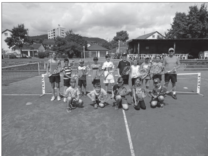
Gruppenbild mit allen Teilnehmern

Am ersten Ferientag konnten die Rietheimer Kinder, welche Spaß am Tennis haben, sich im Umgang mit dem gelben Filzball ausprobieren und das im Rahmen vom Kinderferienprogramm.