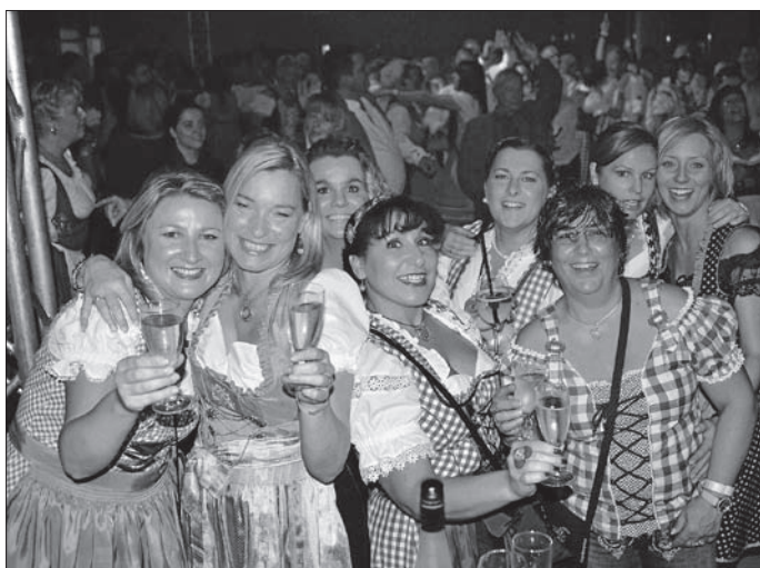
Am 22. Oktober ist es soweit, dann steigt „Ü30 – Die Oktoberfest-Party“ erstmals in der Jahnhalle in Weilheim. Der Vorverkauf läuft.

Von 20 bis 2 Uhr gibt es am 22. Oktober in der Weilheimer Jahnhalle die besten Songs aus den 80er-/90er-/2000er-Jahren bis heute und selbstverständlich sämtliche angesagten Wiesn- und Wasenkracher zu hören. DJs und Band sorgen dafür, dass jeder auf seine Kosten kommt und unbeschwert getanzt und vor allem zünftig gefeiert werden kann. Einlass ist ab 30 Jahren. Dirndl und Lederhose sind zwar keine Pflicht, doch feiert es sich bei einer Oktoberfest-Party im entsprechenden Outfit noch besser als sonst.