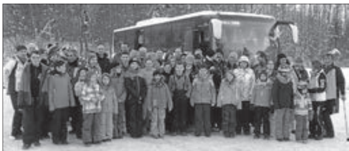
Ein super schöner Skitag ist zu Ende!