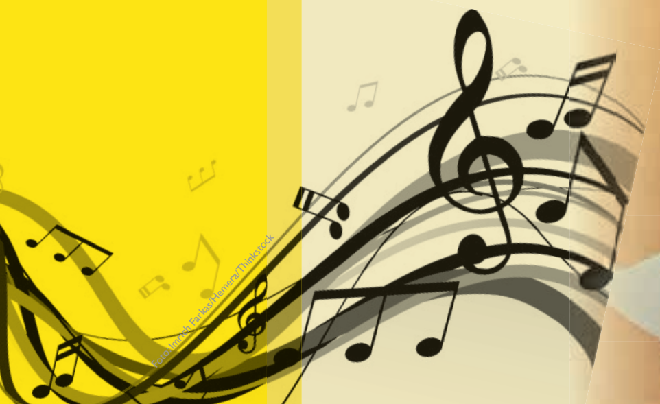
Fortsetzung Seite 4