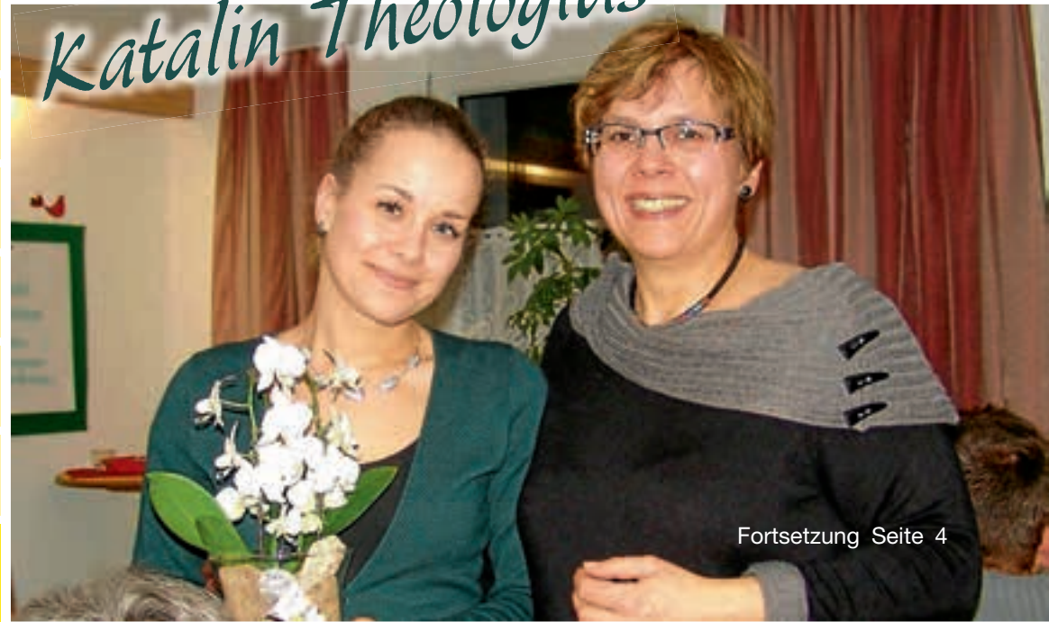
Fortsetzung Seite 4