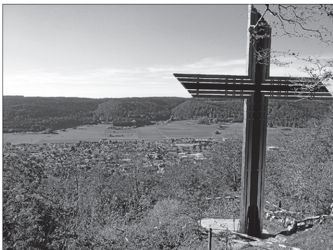
Blick vom Fürstenstein mit dem neuen Kreuz auf Weilheim.

Rietheim-Weilheim hat jetzt neben der bereits seit Jahren angestrahlten "Maria Hilf" Kapelle als weitere Attraktion ein beleuchtetes Kreuz auf dem Fürstenstein.