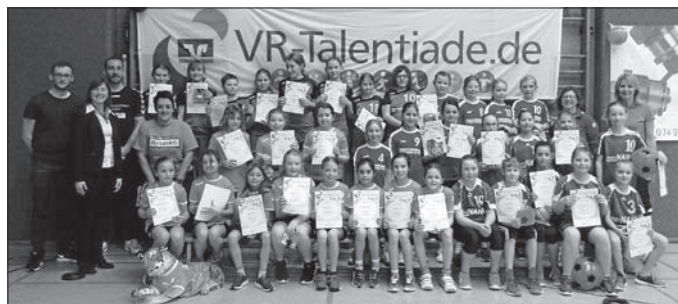
Die Talente der weiblichen E Jugend Staffel 2

Zahlreiche Informationen, Berichte und Fotos sind auch unter: www.vr-talentiade.de zu finden!