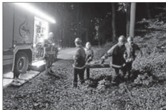
Personensuche mit Rettung aus unwegsamem Gelände