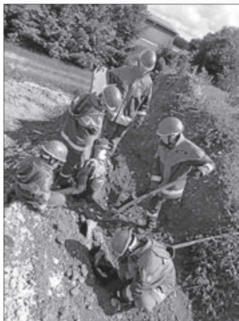
Rettung einer verschütteten Person

Falls ihr Interesse an der Jugendfeuerwehr habt, dürft ihr gerne zum schnuppern vorbei kommen. Wir Proben jeden zweiten Donnerstag von 18 - 20 Uhr. Die nächste Jugendfeuerwehrprobe ist am Donnerstag, 21.06.2018. Weitere Informationen und den Probenplan findet ihr auf unserer Homepage www.feuerwehr-rietheim-weilheim.de