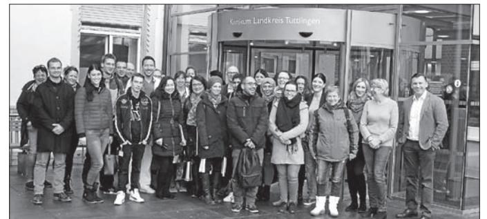
Neue Mitarbeiter und Klinikleitung vor dem Haupteingang des Gesundheitszentrums Tuttlingen

Das Klinikum zeichnet sich als zukunftsorientiertes und familienfreundliches Krankenhaus aus, indem es flexible Arbeitszeitmodelle, eine betriebseigene Kindertagesstätte für 0- bis 6-jährige Kinder und einen modernen Arbeitsplatz anbietet. Zusätzliche Kurse des betrieblichen Gesundheitsmanagements, zum Beispiel verschiedene Yoga-Kurse, und die Vergütung nach TVÖD mit entsprechenden Sozialleistungen runden das Angebot ab.