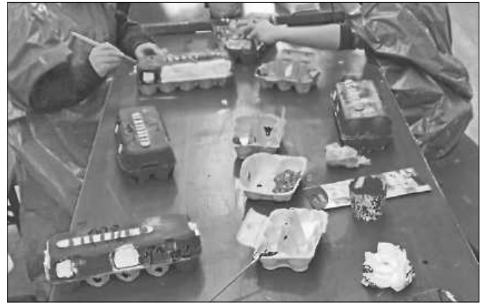
Basteln mit der Kinderfeuerwehr

Die Kinderfeuerwehr erfreut sich weiterhin großer Beliebtheit und hat dieses Jahr bereits fünf Übungen durchgeführt.