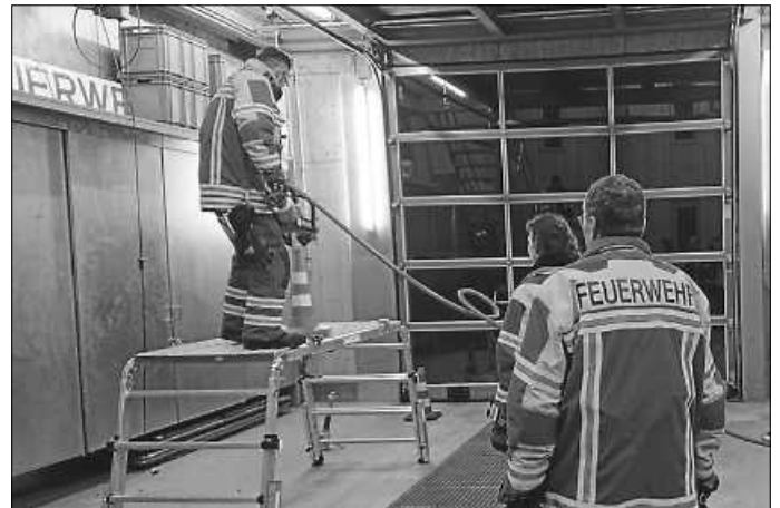
Gemeinsame Übung in Riethem

Die eigentliche Aufgabe der Feuerwehr, die Durchführung von Übungsdiensten kam auch nicht zu kurz, in vielen Stunden übten wir die grundlegenden Techniken des Feuerwehrwesens. Hierzu gehören zum Beispiel der Löschangriff, Technische Hilfeleistung, Spülen von Unterflurhydranten, Wasserentnahme aus offenen Gewässern und Knotenkunde.