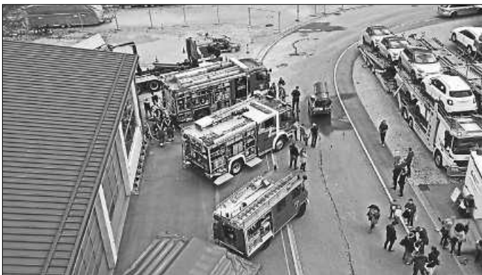
Tag der offenen Tür

Auch der Tag der offenen Tür im Mai war mit Arbeit verbunden – hier haben wir uns sehr gefreut, dass dieser Termin so gut angenommen wurde und wir viele Besucher willkommen heißen durften.