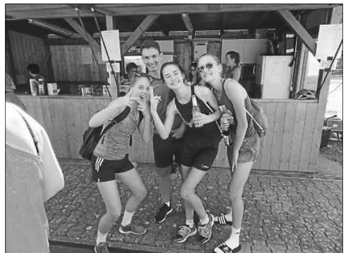
Nach den Bundesjugendspielen waren dann auch die „Älteren“ dran, deren Vorfrende nicht zu übersehen war.