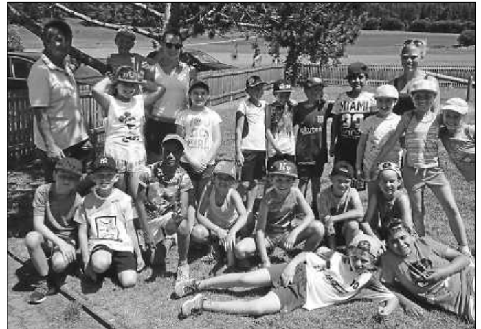
Bei den Bundesjugendspielen hatten alle sehr viel Spaß. Hier die Klasse 3.