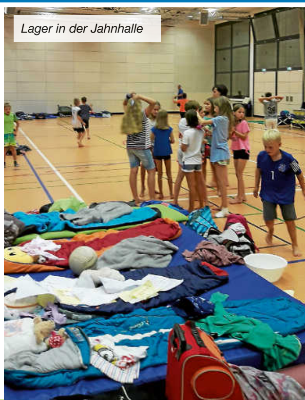
Lager in der Jahnhalle