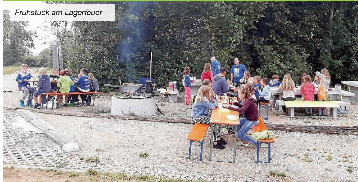
Frühstück am Lagerfeuer