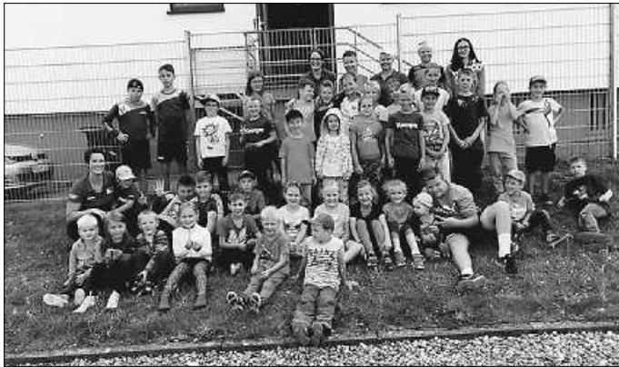
Auch dieses Jahr war wieder eine große Gruppe Kinder und Betreuer beim Kinderferienprogramm mit dabei.

Am Dienstagnachmittag trafen sich 33 Kinder und 10 Betreuer bei schönem Wetter auf dem Kleinspielfeld in Rietheim zu einem Spielenachmittag. Die TSV'ler haben 15 verschiedene Stationen aufgebaut. Nach kurzer Begrüßung teilten sich die Kinder in 5 Gruppen auf und absolvierten mit ihren Betreuern, Lina, Janik, Julie, Felix und Noah die verschiedenen Stationen.