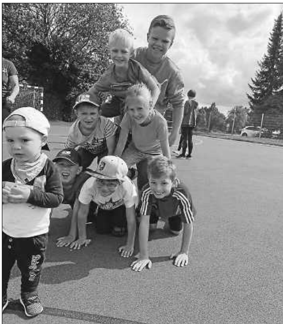
Bei bestem Wetter hatten alle ihren Spaß.

Die Kinder bewiesen ihr Geschick z. B. beim Hockey-Golf, Eierlauf, Stelzenlauf, Angelspiel, Dosenwerfen, Jenga, Zielstechen oder Wackelbrett. Die Gruppenspielen wie Twister, Wäscheklammerhängen oder Pyramide bauen fanden alle besonders lustig. Auspowern konnten sie sich bei dem Spiel „Halte-das-Feld-frei“, bei welchem so viele Kuscheltiere wie möglich im gegnerischen Feld liegen bleiben sollten. Auch ein gutes Gehör bewiesen alle Kinder, im Alter von 5 -12 Jahren, beim Geräusche erraten.