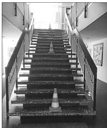
Laufwege im Treppenhaus