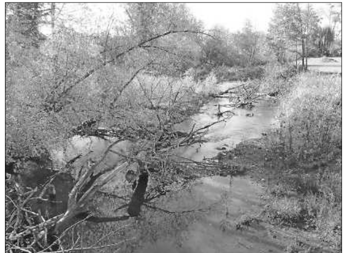
Gelungene Renaturierung: Die alte Kinzig bei Willstätt im Ortenaukreis