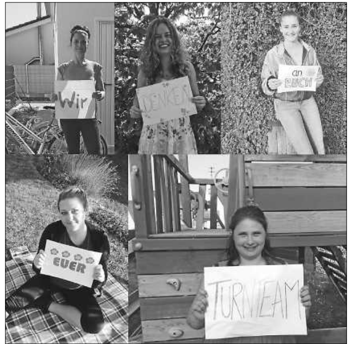
Das Turnteam denkt an euch alle.