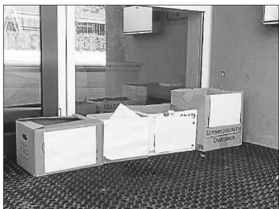
Klassenbriefkästen für erledigte Aufgaben