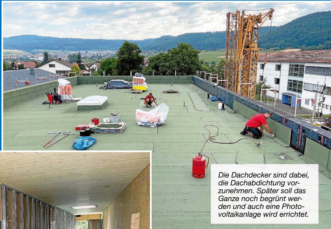
Die Dachdecker sind dabei, die Dachabdichtung vor- zunehmen. Später soll das Ganze noch begrünt wer- den und auch eine Photo- voltaikanlage wird errichtet.

Wir möchten vorsorglich darauf hinweisen, dass in der Ferienzeit nicht immer alle Dienststellen im Rathaus besetzt sind.