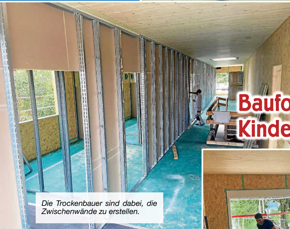
Die Trockenbauer sind dabei, die Zwischenwände zu erstellen.