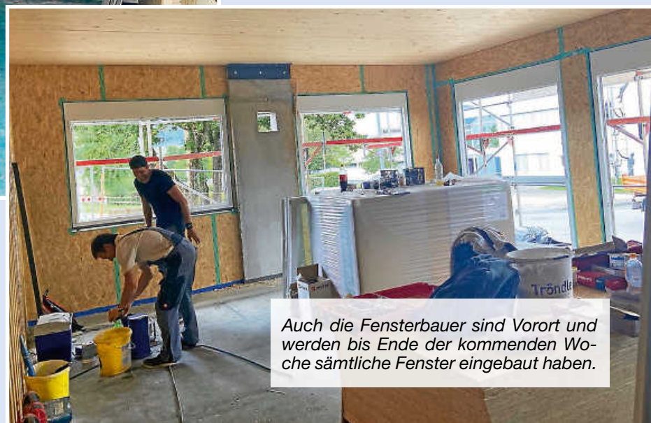
Auch die Fensterbauer sind Vorort und werden bis Ende der kommen- den Woche sämtliche Fenster ein- gebaut haben.