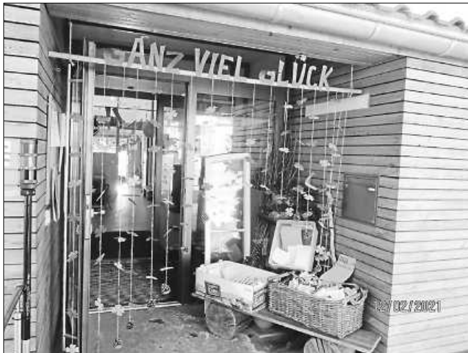
Eingangsbereich des Evangelischen Kindergartens Rietheim

Unterdessen laufen nicht nur die Innen- und Außenarbeiten beim Kindergartenneubau auf Hochtouren, sondern auch das Stellenausschreibungsverfahren hat höchste Priorität – und wir hoffen sehr auf große Resonanz.