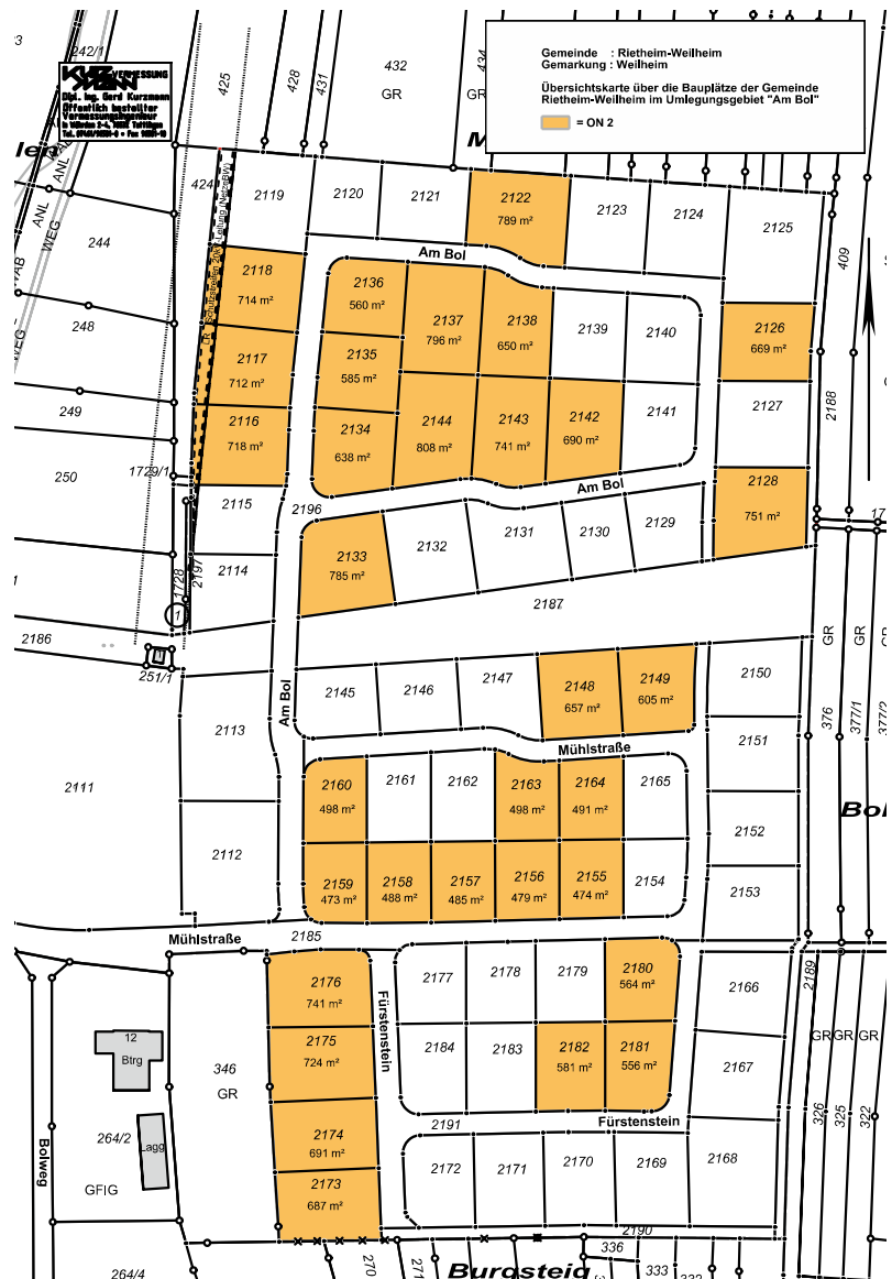
Karte M 1 : 1000 mit farblicher Darstellung der Gemeindebauplätze

Im Nachgang zur Bekanntmachung des Umlegungsbeschlusses drucken wir nachfolgend den Umlegungsplan ab. Auf diesem ist ersichtlich, welche Grundstücke der Gemeinde zur Veräußerung als Bauplätze zur Verfügung stehen. Die gemeindeeigenen Grundstücke sind orange hinterlegt. Aktuell erfolgt die Auswertung der eingegangenen Bauplatzbewerbungen nach den Vergaberichtlinien. Die Vergabe der Bauplätze wird dann aller Voraussicht nach in der Gemeinderatssitzung im April stattfinden.