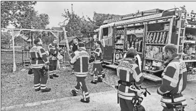
Die Ruhe vor der Übung