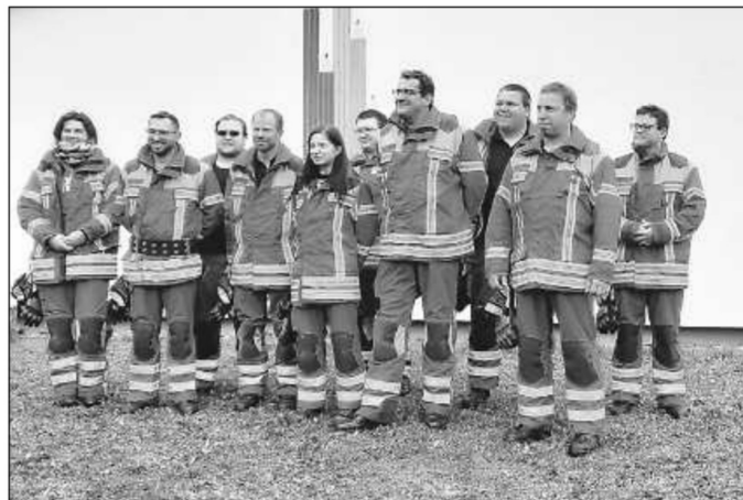
Die Absolventen des Leistungsabzeichens