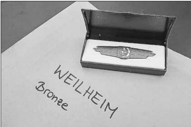
Das Leistungsabzeichen der Feuerwehr in Bronze