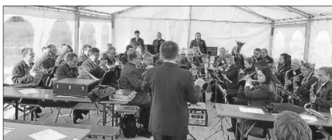
Frühshoppen im Zelt