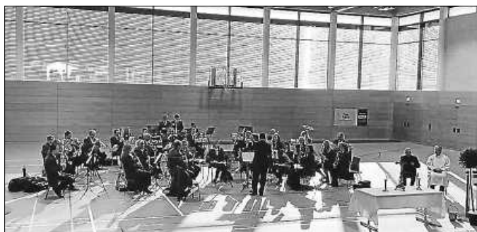
Gottesdienst in der neuen Halle

gemeinsam mit unseren Instrumenten in das Zelt außerhalb der Halle umgezogen. Gut 1,5 Stunden spielten wir verschiedene Märsche und Polkas, aber auch moderne Stücke. Wir hatten sehr viel Freude und Spaß daran, endlich wieder vor Publikum spielen zu dürfen.