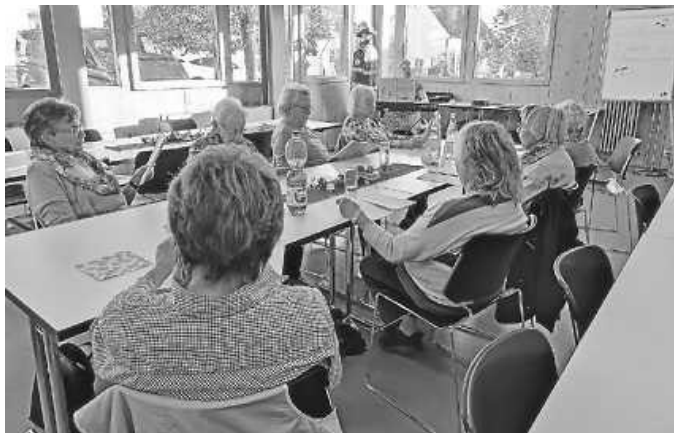
Singen im DRK Raum in Rietheim

Mit Kaffee und Kuchen startete das erste Treffen am Mittwoch, 26.10. im DRK Raum in Rietheim.