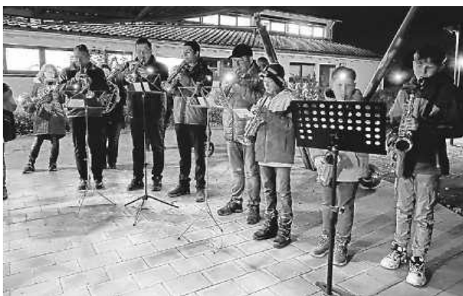
Laternenumzug in Rietheim