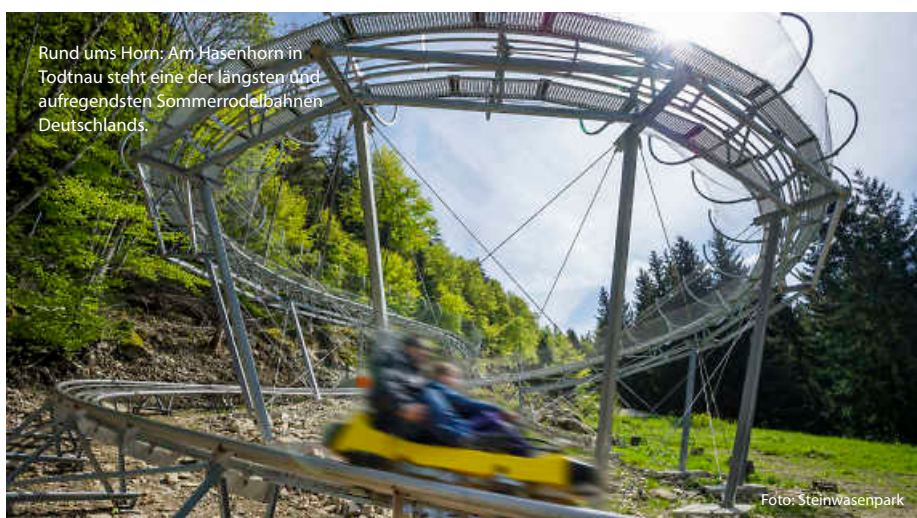
Rund ums Horn: Am Hasenhorn in Todtnau steht eine der längsten und aufregendsten Sommerrodelbahnen Deutschlands.

Und auch im Familienpark Westerheim kommen Rodelfans auf ihre Kosten. Hier auf der Alb findet sich nicht nur eine besonders rasante Strecke, nach der Fahrt reisen Gäste mit dem Lift rückwärts mitten durch das Dinoland. Nussbaum Abonnenten sparen dabei sogar. Also anschnallen und ab geht die wilde Fahrt! (jr/jr/red)