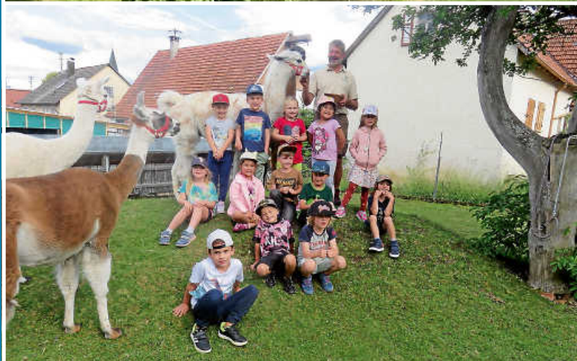
Ausflug der Vorschüler zu den Heuberg Lamas nach Böttingen