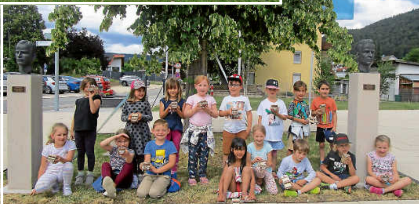
Rietheimer Vorschüler besuchen die Firma Marquardt