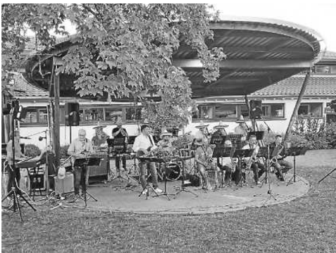
Grandiose Unterhaltung durch Lazy Creek - Faulenbach 2.0