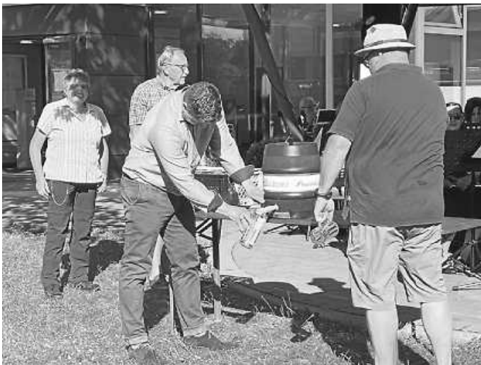
Fassanstich durch den Bürgermeister