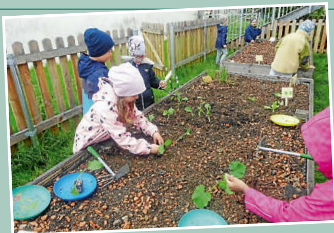
beim Säen und Pflanzen