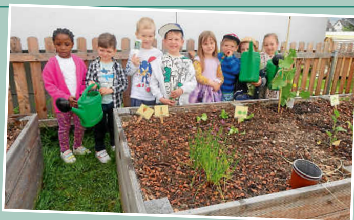
die stolzen Gärtner...

Bei der Neugestaltung des Kindergartens wurden auch hinter dem Gebäude 2 Hochbeete für die Kinder aufgestellt. Leider war es im letzten Jahr nicht mehr möglich, diese zu bepflanzen. Doch in diesem Kindergartenjahr wollten wir auf jeden Fall damit beginnen. Die Altersgruppe der „schlauhen Füchse“ - das sind die 4-5-jährigen Kinder - machten sich mit Feuereifer daran. Zuerst lernten sie die Gartengeräte und den sachgemäßen Umgang damit kennen. Dann haben wir begonnen die Beete zu hacken und für die Bepflanzung vorzubereiten.