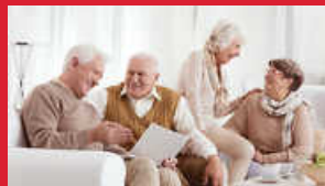
Selbstbestimmt Wohnen im Alter