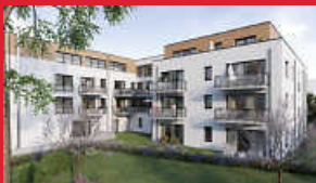
Pflegeimmobilie als Kapitalanlage

IMMENDINGEN | Am Schlossplatz 7 11.00 - 15.00 UHR | Auf dem Grundstück (neben dem Schloss)