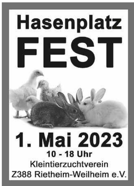
Plakat: Kleintierzuchtverein Z388 e.V.

Wir laden Euch ganz herzlich an unser Hasenheim ein. Es erwartet euch ein vielfältiges Programm für die ganze Familie: