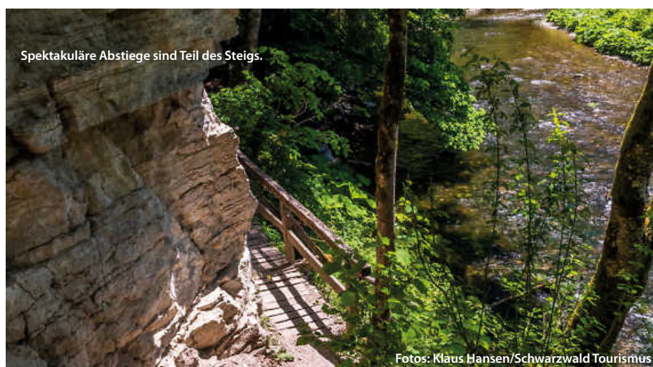
Spektakuläre Abstiege sind Teil des Steigs.

Am Ende macht die Mischung den Reiz des Steigs aus: massive Felswände, enge Pfade, Ursprünglichkeit der Natur, rauschende Flüsse und Wasserfälle, aber ebenso Bergwiesen und imposante Blicke, sowohl in die Ferne (Alpen, Feldberg, Schluchsee) aber auch in die Tiefe der durchwanderten Schluchten. (haf)