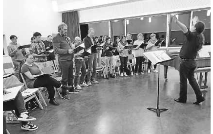
Probe im Musiksaal

shop war bestens durchorganisiert und vorbereitet worden. Alle Teilnehmer lobten dies sehr.