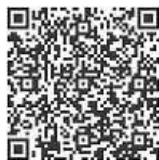
QR-Code zur Anmeldung