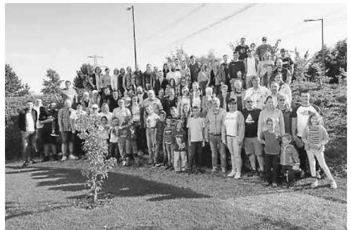
Teilnehmer Vereinsausflug TB Weilheim

Nachdem wieder alle am Bus angekommen waren, fuhren uns Michel und Reinhold wie gewohnt sicher zurück nach Weilheim ins Vereinslokal Krone wo der Abschluss des 2-tägigen Ausflugs stattfand.