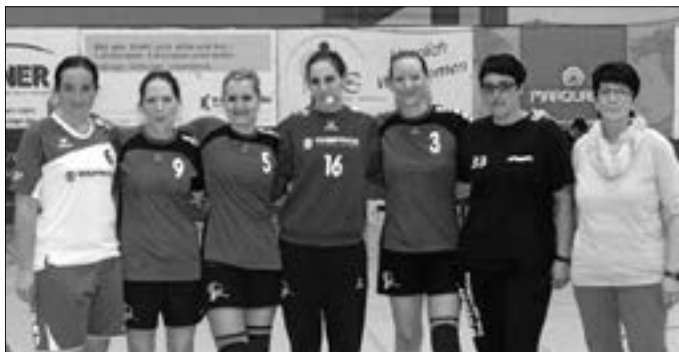
Verabschiedung der aktiven Spielerinnen

Am kommenden Samstag treffen wir um 18:20 Uhr, in unserem letzten Spiel in dieser Runde, auswärts auf den bereits feststehenden Meister und Aufsteiger in die Landesliga, die TG Schwenningen. Obwohl es für beide Teams um nicht mehr viel geht, haben wir uns vorgenommen die TG noch einmal so richtig zu ärgern und würden uns über jegliche Unterstützung freuen.