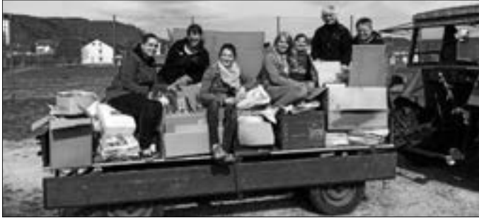
Unsere Frauentruppe beim Papier sammeln

Wie jedes Jahr im Frühjahr waren die fleißigen „Schrottsammler“ des Musikverein Riethem-Weilheim am Samstag, den 11. April im Ortsteil Riethem im Einsatz. Mehrere Teams in verschiedenen Ortsbezirken und ein Frauenteam, welches fürs Altpapier zuständig war, sind von ca. 9 bis 12 Uhr unterwegs gewesen. Die Gruppen sammelten mit von Mitgliedern zur Verfügung gestellten Fahrzeugen (Traktoren, Unimogs, Anhängern...) die Wertstoffe ein. Wir bedanken uns bei der Bevölkerung für die immer wieder zuverlässig großen Mengen an bereitgestellten Altmaterialien. Gleichzeitig weisen wir die Bewohner auf unsere 2. Jahressammlung am 24. Oktober hin. Es ist bestimmt noch genug in Keller, Scheune und Dachboden welches Sie gerne entsorgen würden! Der Musikverein Riethem-Weilheim freut sich auf die nächste Altmaterialsammlung bei Ihnen!