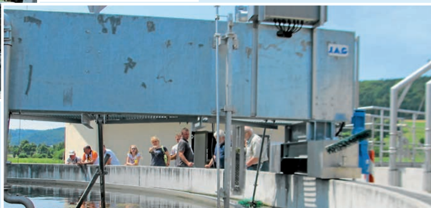
Die Führungen am „Tag der offenen Tür“ wurden gut angenommen