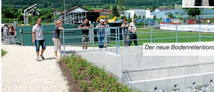
Der neue Bodenretentionsfilter