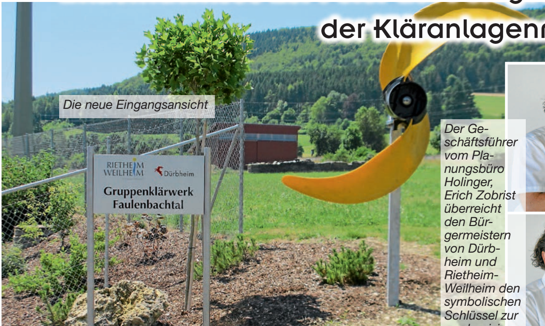
Die neue Eingangsansicht