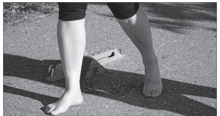
... heiße Füße und gingen deshalb barfuß an den Start. Zu wem gehören wohl diese schlanken und fast sauberen Füße? „Zeigt her Eure Füße, ...“. Wer es errät, darf sich bei Michael Hipp melden mit der Chance, ein Getränk zu gewinnen!