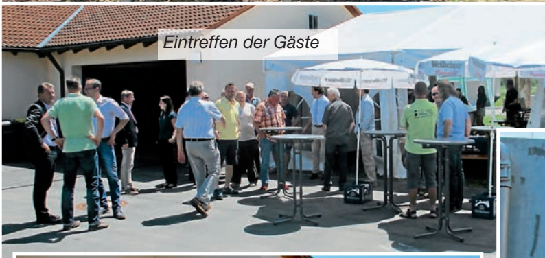
Eintreffen der Gäste