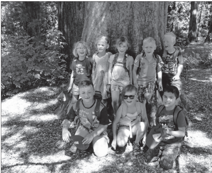
Vorschüler in der Wilhelma

Am Dienstag, 30. Juni war es endlich soweit, der eifrig herbeigesehnte Tag war für die Weilheimer Vorschüler gekommen. Acht Kinder machten sich gemeinsam mit ihren Erzieherinnen mit dem Zug auf den Weg nach Stuttgart in die Wilhelma. Schon die Zugfahrt war für die Kinder ein besonderes Erlebnis und in Stuttgart am Hauptbahnhof angekommen, ging es dann voller Vorfreude zur Wilhelma. Nachdem die Eintrittskarten gelöst waren, ging es auf die Entdeckungstour durchs Tierreich. Die Vorschüler bekamen Giraffen, Zebras, Löwen, Leoparden, Elefanten, Seehunde, Nilpferde, Krokodile, Pinguine und noch viele andere Tiere zu sehen. Die Erzieherinnen wussten auch etwas über die Zootiere zu berichten, sodass es ein sehr spannender und interessanter Tag war. In der Mittagspause stärkten sich alle mit Wurst und Pommes und auch ein Eis durfte an diesem heißen Sommertag natürlich nicht fehlen. Die Zeit verging viel zu schnell und kurz nach 18.00 Uhr kamen alle erschöpft und glücklich wieder in Spaichingen an.