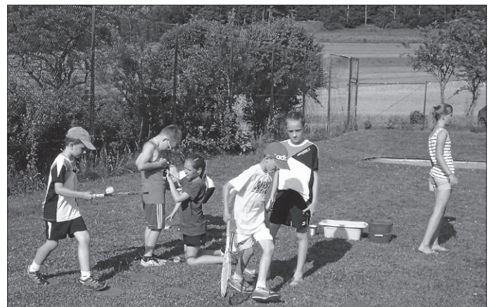
Der Tennisabend war wieder ein gemütlicher Abend, bei dem spannende Ballwechsel zu sehen waren. Aber auch die Kleinen hatten bei der Spielstraße großen Spaß.