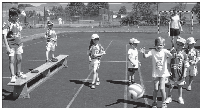
Am Sonntag trotzten die Teilnehmer des Minispielfestes beim Turmball den hohen Temperaturen und waren mit Eifer dabei. Natürlich waren die Spiele und Wettkämpfe speziell auf die hohen Temperaturen abgestimmt. Deshalb war immer wieder Wasser mit im Spiel. Dass aber ...