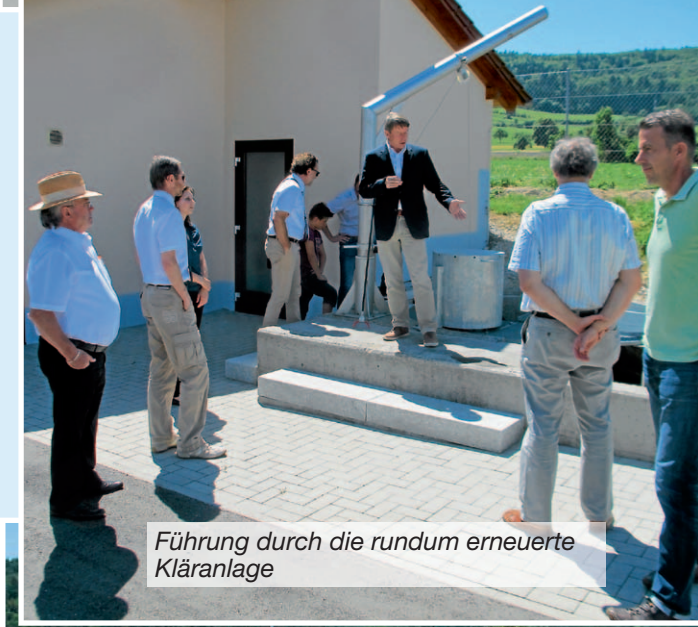
Führung durch die rundum erneuerte Kläranlage