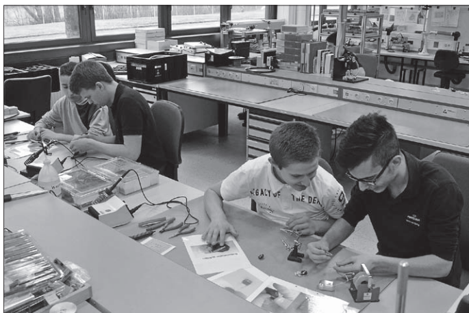
Die Auszubildenden bei Marquardt gewähren den Schülern der Albert-Schweizer-Schule einen Einblick in die technische Ausbildung bei Marquardt.

Der ROCK YOUR LIFE! Tuttlingen e. V. besteht seit 2014. Ziel des Vereins ist es, Schüler aus sozial, wirtschaftlich oder familiär benachteiligten Verhältnissen in ihrer beruflichen Orientierung zu unterstützen. Studierende fungieren als Mentoren, die die Schüler auf dem Weg in den Beruf oder auf die weiterführende Schule begleiten. Dadurch erschließen sich den Schülern neue Perspektiven und Chancen. Die Mentoren selbst haben nicht nur die Möglichkeit, sich sozial zu engagieren, sondern erwerben selbst praktische Fähigkeiten für den eigenen Berufseinstieg und können erste Kontakte zu Unternehmen knüpfen. Für Unternehmen erschließen sich dadurch Möglichkeiten zur Gewinnung qualifizierter Fachkräfte.